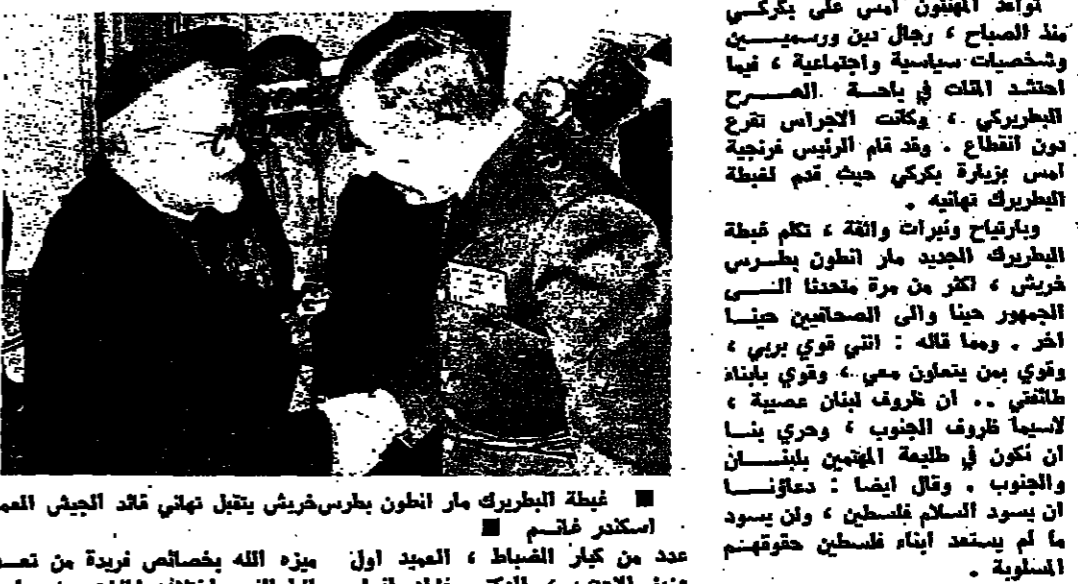
غبطة البطريك ماراطون بطرس خريش يتقبل تهاني قائد الجيش العماد اسكندر خنيص

وتد من اهالي بلدة «عين ابل» يهني، ابن البلدة غبطة البطريك خريش... وصلت مسيحة الامام موسى الصدر... مناهنا فاستطرد يقول: يرسنا ان نحتسب... عن الجنوب وقضاياهم بحضور احد... حياهم لواء النخاع عن جنوب لبنان... وعن لبنان، ونسأله تعالى ان يوفقنا... نعيم السلام والعدل والاستقرار... والمحبة، ليعود القاسم مبردين... «هنا لمن له مرتبة عزلة في لبنان»... وتبعنا بطريك خريش... وجانبه الامام الصدر قل غبطة: انا